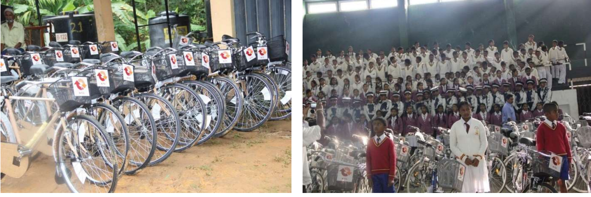
பகிர்ந்தளிக்கப்பட்ட மிதிவண்டிகள் மற்றும் மாணவர் கூட்டம்

பிரதேசத்தில் காணப்படும் உட்கட்டமைப்பு வசதிகள் குறித்து திருப்தியடைய முடியாத கஷ்டப் பிரதேசங்களில் சிசு செரிய செயற்றிட்டத்தின் கீழ் போக்குவரத்து வசதிகளை வழங்குவது கடினமாகையால், பாடசாலை மாணவர்களுக்கான சுற்றாடல் நேயமிகு மற்றும் கிராமிய பொருளாதாரத்திற்கு ஒத்துப் போகும் போக்குவரத்து ஊடகமாக மிதிவண்டியினை அறிமுகப்படுத்தும் நோக்கில் தேசிய போக்குவரத்து ஆணைக்குழுவினால் இச்செயற்றிட்டம் ஆரம்பிக்கப்பட்டது. மிகவும் சிறந்த சமூக சேவையான இம்மிதிவண்டிகள் பகிர்ந்தளிப்பு கிராமிய பிரதேசங்களில் வாழும் பாடசாலைச் சிறார்களுக்காக சிசு செரிய செயற்றிட்டத்தின் கீழ் இலவசமாக மேற்கொள்ளப்படுகின்றது.