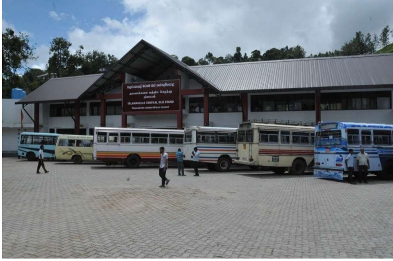
தலவாக்கலை பேருந்துத் தரிப்பிடம்

தேசிய போக்குவரத்து ஆணைக்குழுவினால் தூரப்பயணச் சேவைகளுக்குரிய உட்கட்டமைப்பு வசதிகளை அபவிருத்தி செய்யும் செயற்றிட்டத்தின் கீழ் 2014ஆம் ஆண்டில் தலவாக்கலை நகரத்தில் ஆரம்பிக்கப்பட்ட பேருந்துத் தரிப்பிடத்தை அமைக்கும் பணிகளை நிறைவு செய்து 2015.10.31ஆந் திகதி போக்குவரத்து மற்றும் சிவில் விமான சேவை கௌரவ அமைச்சர் நிமல் சிறிபால டி சில்வா அவர்களின் தலைமையில் மக்கள்மயமாக்கப்பட்டது.