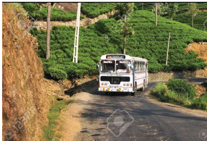
“கெமி செரிய” கிராமிய பேருந்துச் சேவை

நவீன உலகின் மனிதனுக்கு அத்தியாவசியமான சேவைகளுள் முதலிடத்தை வகிக்கும் சேவையாகப் போக்குவரத்து மாறியுள்ளமை, தத்தமது பாரம்பரிய நிலங்களை விட்டு விட்டு நகர்ப்புறத்தை நோக்கி குடிபெயரும் பெரும் எண்ணிக்கையிலான மக்கள் கூட்டம் மூலம் தெளிவாகப் புலனாகின்றது.