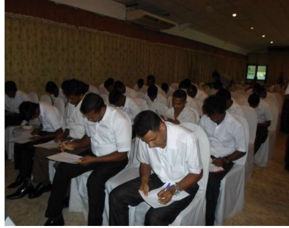
பயிற்சி நிகழ்ச்சியொன்றில் பங்குபற்றிய பேருந்து ஊழியர் குழு

தனியார் பேருந்துகளில் பணியில் ஈடுபட்டிருக்கும் சாரதிகள் மற்றும் நடத்துனர்களின் நடத்தைக் குறித்து சமூகத்தில் ஓரளவு வரவேற்கப்படாத நிலைமை காணப்படுகின்றமை அத்துறை வீழ்ச்சியடைவதற்கு பெரிதும் ஏதுவாயுள்ளது. அதனால், இப்பயிற்சி நிகழ்ச்சிகள் நாட்டில்