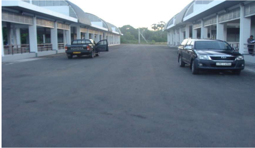
பணிகள் முடிவுறும் கட்டத்தில் வவுனியா பேருந்துத் தரிப்பிடம்

2014 ஜனவரி 31ஆந் திகதி நிர்மாணப் பணிகள் ஆரம்பிக்கப்பட்டு, ஏற்கனவே முதலாம் கட்ட பணிகள் முடிவுற்ற நிலையில் வவுனியா புதிய பேருந்துத் தரிப்பிடம், விவசாய ஆராய்ச்சி நிலையத்தினால் வழங்கப்பட்ட மூன்று ஏக்கர் காணியில் மிகவும் அழகான முறையில் அமைக்கப்பட்டுள்ளது. இலங்கை பொறியியற் கூட்டுத்தாபனத்தினால் தயாரிக்கப்பட்ட திட்டத்தின் படி 800 சதுரமீற்றர் மற்றும் 1100 சதுரமீற்றர் பரப்பளவு கொண்ட 02 கட்டடங்கள் காணப்படுகின்றன. பார்க்கும் எல்லாரினதும் மனதை ஈர்க்கும் விதத்தில் சிறந்த திட்டத்தின் படி நிர்மாணிக்கப்பட்டுள்ள இக்கட்டட வளாகத்தின் வெளிப்புற அழகு போன்றே உட்புறமும் மிகவும் கட்டுக்கோப்புடன் நிர்மாணிக்கப்பட்டுள்ளது. மாகாணங்களுக்கு இடையிலான மற்றும் மாகாண போக்குவரத்து அலுவலகங்கள், பல்வேறு வகை உணவுகள், பானங்களை வாங்கக்கூடிய 2 சிற்றுண்டிச்சாலைகள்,