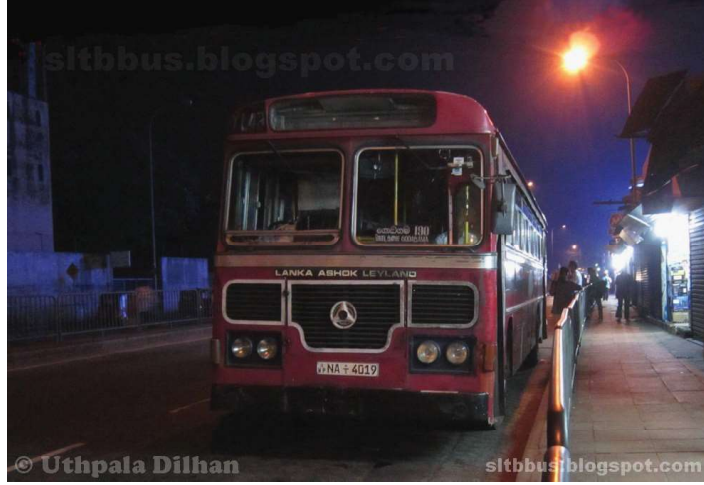
“நிசி செரிய” இரவு நேரப் பேருந்துச் சேவை

இலங்கையின் பொருளாதார மற்றும் சமூக அபிவிருத்தி, அதற்காகத் தமது முயற்சியை, ஆர்வத்தை மற்றும் அர்ப்பணிப்பை வழங்கும் மக்களில் தங்கியுள்ளது. அவர்களுள் அநேகமானோர் தூரப்பிரதேசங்களிலிருந்து தினமும் நகரை நோக்கிச் சென்று தமது உடல் உழைப்பினைப் பெற்றுக் கொடுப்பதைக் காணலாம். அதனால் அநேகமானோர் அதிகாலையில் வீட்டிலிருந்து புறப்பட்டு இரவு வேளையில் விடு திரும்புவர். எனினும் அவர்களது அடிப்படைத் தேவையாக மாறியுள்ள போக்குவரத்துச் சேவை உரிய நேரத்தில் கிடைக்காமை அவர்கள் தைரியம் இழப்பதற்கு ஏதுவாக அமையலாம்.