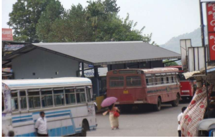
நவீனமயப்படுத்தப்பட்ட வத்துமல்ல பேருந்துத் தரிப்பிடம்

குறிப்பிட்ட நவீனமயமாக்கல் பணிகள் 2015ஆம் ஆண்டினுள் நிறைவு செய்து மக்களுக்காகத் திறந்து வைக்கப்பட்டதுடன் அதற்கான மொத்தச் செலவு 8.9 மி. ரூபாவாகும்.