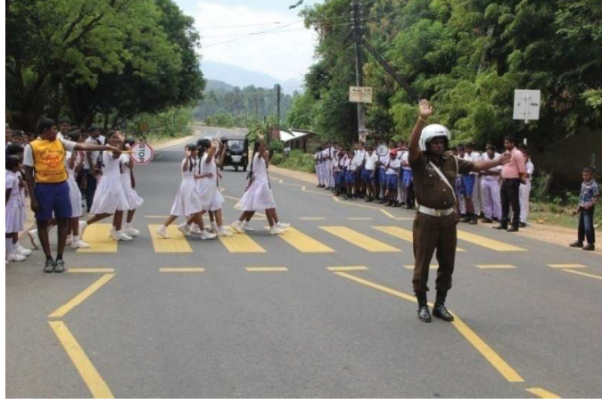
வீதிப்பாதுகாப்பு தொடர்பில் செயலமர்வு

தினமும் இலங்கையில் வாகன விபத்தின் காரணமாக 7 பேருக்கும் கூடுதலானோர் உயிரிழப்பதாக வீதி விபத்துக்கள் தொடர்பிலான தரவுகள் உறுதிப்படுத்துகின்றன. வீதி விபத்துக்களினால் காயமுறுவோருக்கு அரசாங்கம் வருடத்திற்கு பில்லியன் ரூபா அளவில் செலவிடுகின்றது. குடும்பமொன்றின் பொருளாதாரச் சமையினை சுமக்கும் நபர்கள் விபத்துக்குள்ளாவதனால் ஏற்படக் கூடிய பொருளாதார ரீதியான மற்றும் சமூக ரீதியான பிரச்சினைகள் அதிகமாகும். இதற்கு மேலதிகமாக அண்மைக் காலங்களில் பாடசாலைச் சிறார்கள் விபத்துக்குள்ளாகும் போக்கும் அதிகரித்திருப்பது கவனத்திற் கொள்ளவேண்டியதொரு விடயமாகும்.